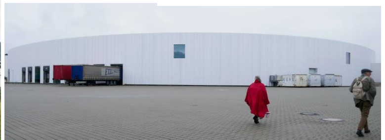
Montagehalle von SANAA