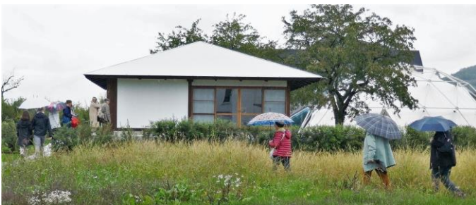
„Umbrella-Haus“ von Kazuo Shinohara